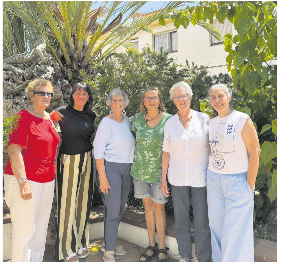
Equip de voluntàries de Càritas Altafulla

Si vius a Altafulla i t'agradaria dedicar part del teu temps a ajudar qui més ho necessita, no t'ho pensis més i fes voluntariat! No cal tenir coneixements específics ni disposar de moltes hores. Només cal tenir ganes d'escoltar, compartir i estar al costat d'una persona gran... i és que, una hora a la setmana pot marcar una gran diferència! Perquè, quan compartim temps, combatem la solitud i construïm comunitat.